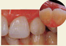
レジンを詰めて治療が 終了したところ

レジンにも様々な種類があります。世界中の多くの歯科医師から信頼され使用されているメジャーメーカーから、医療後進国と言われる国の聞いたことのないメーカーまで様々です。日本は、世界で一番接着剤の特許が多く、高い技術力を有しています。当院では、松風社の国産レジンを使用しております。