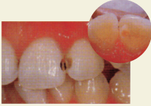
むし歯をとったところ